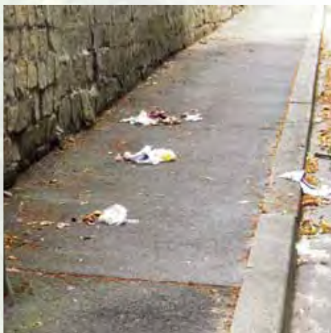
Trottoir rue de Touthville

Attitude élémentaire pour le respect de la propreté de notre village.