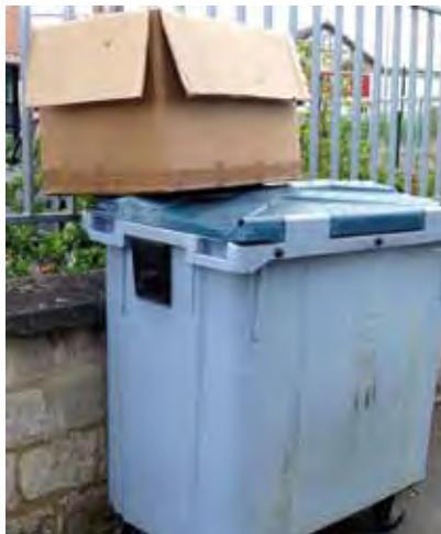
Trottoir rue de Royaumont