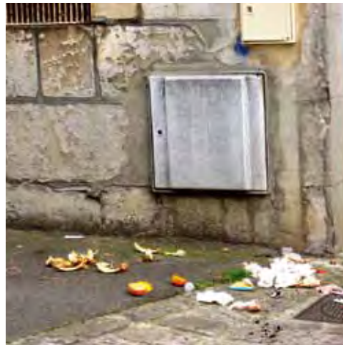
Trottoir rue P. Brossolette

Face à ces constats fréquents, il a été demandé au service communication du syndicat intercommunal TRI OR un suivi de collecte sur l'ensemble de notre commune avec intervention des ambassadeurs de tri auprès de chaque contrevenant.