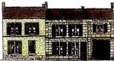
Maisons de Pays