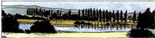
Etang aux Moines