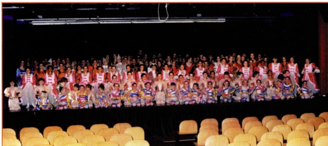
Gala de danse