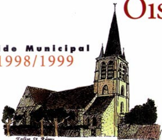
Eglise St. Rémy