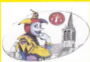
ANIM' ASNIERES - ROYAUMONT

Réservation obligatoire . Places limitées.