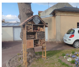
Installation d'un gîte à insectes dans la cour de la mairie.