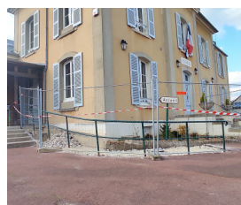
Mise en place d'une nouvelle rampe d'accès PMR (Personnes à Mobilité Réduite) en mairie.