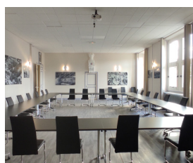
Relooking de la salle du conseil municipal.

Le dimanche 2 mai (sous réserve), une grande journée citoyenne de la propreté est organisée par la ville de Viarmes avec ses partenaires, les communes d'Asnières-sur-Oise, Belloy-en-France, Saint-Martin-du-Tertre et Seugy. Rendez-vous sur la place Pierre Salvi de Viarmes à 8h (café à emporter offert).