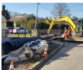
Restauration des berges et d'une passerelle de Baillon.