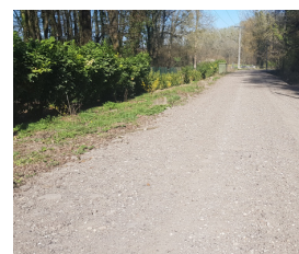
Remise en état du CR3 menant au camping des Princes.