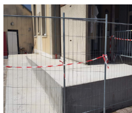
Rampe PMR mairie