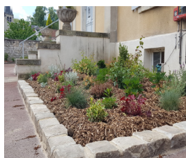
Aménagement devant la mairie