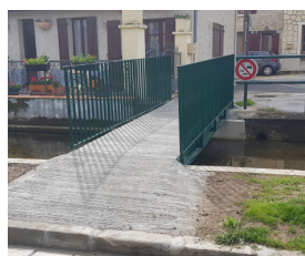
Réouverture du pont de Baillon