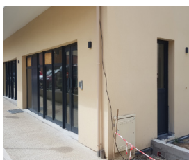
Travaux aménagement multi-accueil