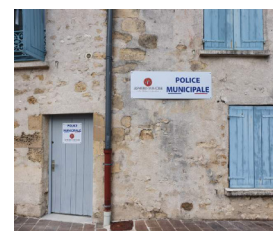
Aménagement du local de la police municipale