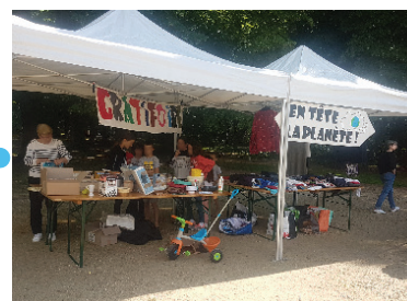
Grati Foire du 27 juin