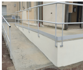
Rampe PMR Mairie terminée