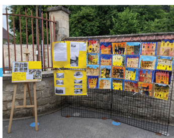
Exposition de l'école Blanche de castille du 19 juin