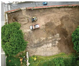
Travaux préparatoire à l'aménagement du nouveau parking angle rue Delchet