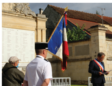
La commémoration du 18 juin