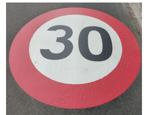
Marquages au sol «zone 30» pour la sécurité de tous