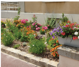
Aménagement de massifs de fleurs devant la mairie