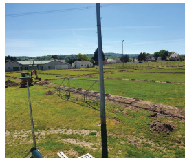
Arrosage automatique terrain de foot Maspoli (Sivom)