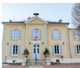
Réfection des volets et de la porte de la mairie.