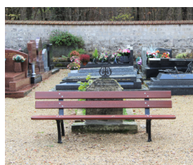
Installation d'un banc dans le cimetière de Baillon.