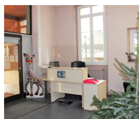
Modification de l'accueil de la mairie.