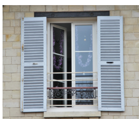
Changement des fenêtres de l'école Blanche de Castille.