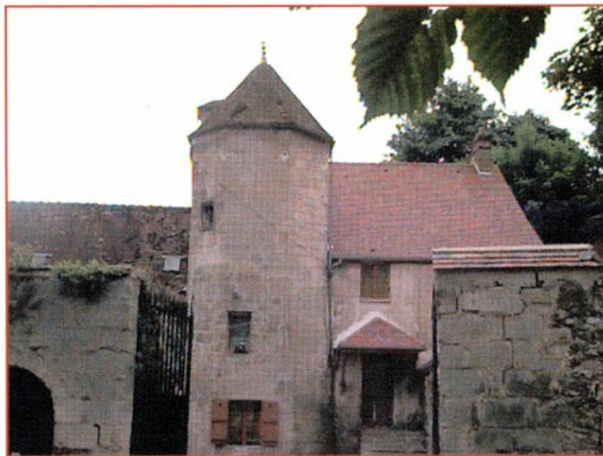
Le Petit Royaume