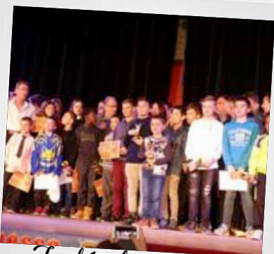
Trophée des sports de Viarmes 3 mars 2017