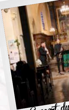
Concert du saxophon 22 janv