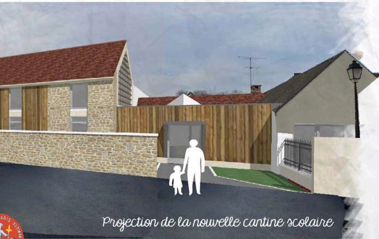
Projection de la nouvelle cantine scolaire