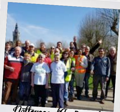
Nettoyage d'Asnières et Viarmes 26 mars 2017

événements auxquels vous avec en toile de fond, une ure cantine scolaire.