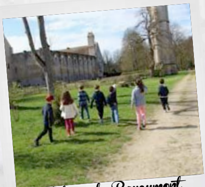
Ateliers de Royaumont pour l'école du Bois Bonnet 28 mars 2017