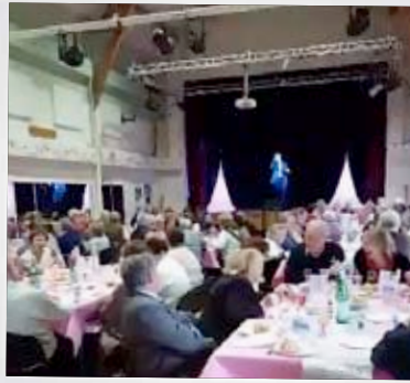
Repas du CCAS 15 janvier 2017