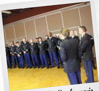
Inspection de Gendarmerie 28 février 2017