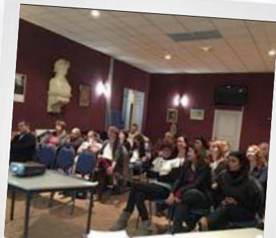
Réunion de présentation du nouveau restaurant scolaire 24 janvier 2017