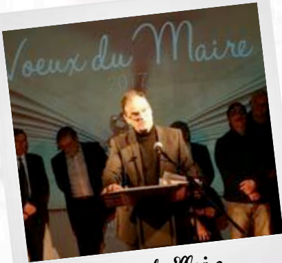
Voeux du Maire 6 janvier 2017