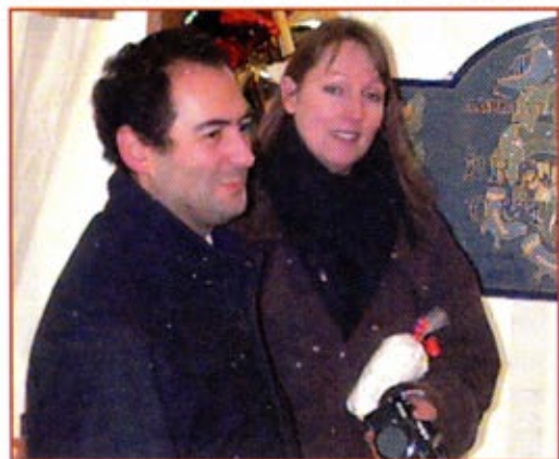
Un marché gourmand réussi... avec la présence de Mr le Maire de CUTIGLIANO