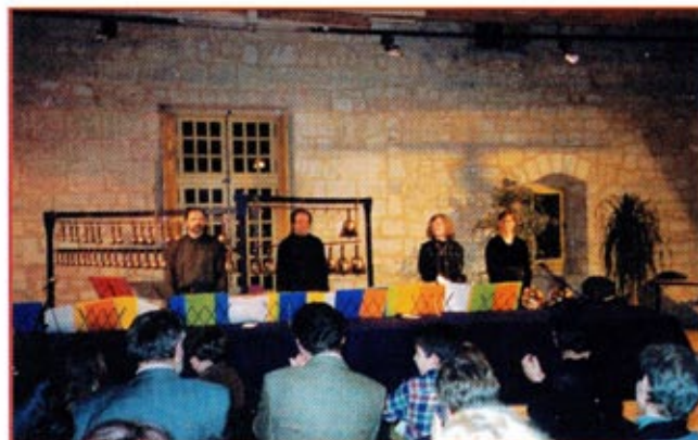
Un concert de cloches remarqué...