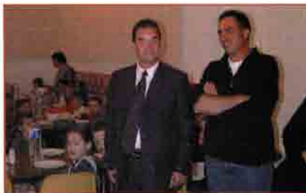
Distribution de bouteille d'eau à la Cantine