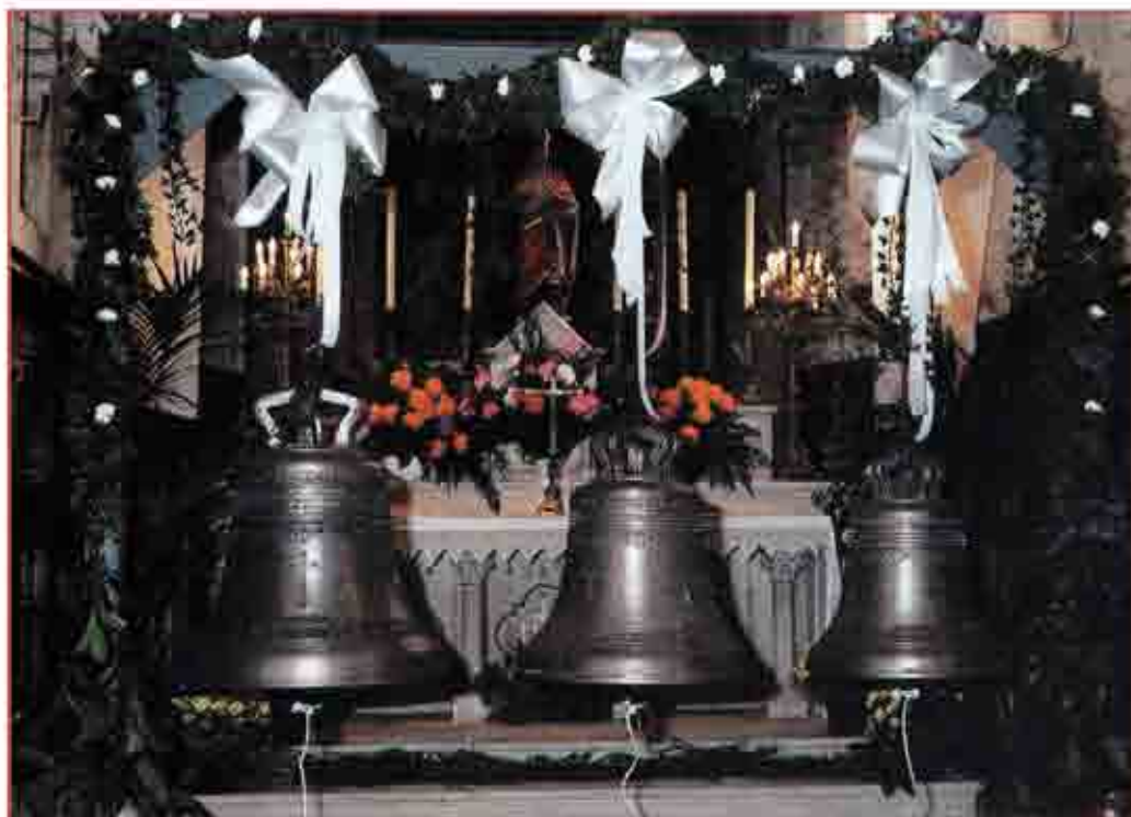
Les 3 cloches Loutise, Clotilde et Marie-Emmanuelle