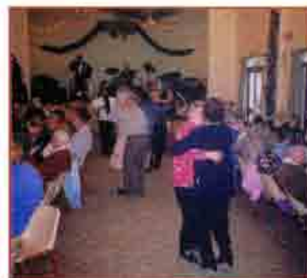
Toujours plus de monde et d'ambiance au repas des anciens du 19 décembre 1999.