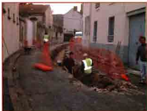
Démarrage des travaux rue d'Aval-Eau