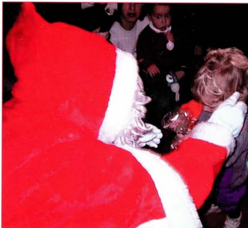
Noël, toujours le même mystère...