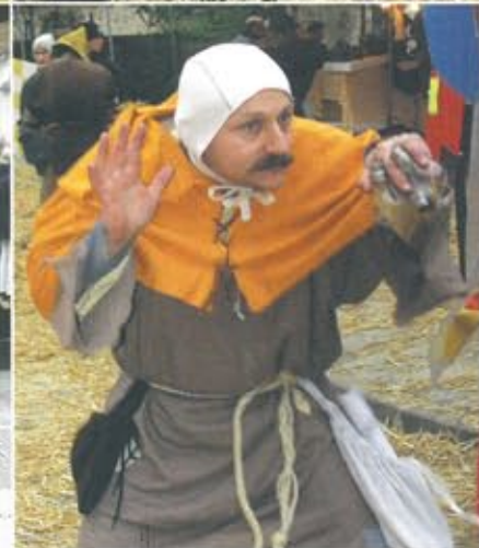
La totalité des photos (plus de 200) sur www.ville.asnieres-sur-oise.fr rubrique Marché Médieval