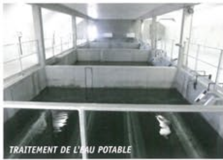
TRAITEMENT DE L'EAU POTABLE

L'unité de traitement de l'eau potable, située au bord de la RD 922, est en service depuis le 15 novembre 2005.