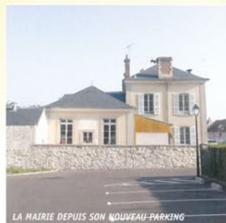
LA MAIRIE DEPUIS SON NOUVEAU-PARKING