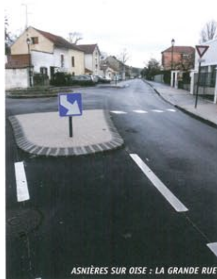
ASNIÈRES SUR OISE : LA GRANDE RUE

Plusieurs réunions publiques se sont tenues et chacun a pu s'exprimer, même si toutes les remarques n'ont pas été prises en compte, des corrections ont été apportées depuis, et d'autres suivront, si c'est nécessaire. Comme annoncé, les travaux ne sont pas complètement terminés, puisqu'une troisième tranche devrait débuter en 2006. La pose de jardinières sur la portion rue de Toutedville et rue d'Aval Eau, pour réduire la vitesse et protéger les véhicules, doit être exécutée