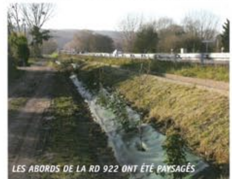
LES ABORDS DE LA RD 922 ONT ÉTÉ PAYSAGÉS

Pour tenir compte des évolutions et sécuriser tous les usagers, le Conseiller Général et Maire de Viarmes, Madame le Maire de Noisy et le Maire d'Asnières sur Oise étudient une solution globale avec le Conseil Général du Val d'Oise qui pourrait déboucher sur la construction et l'aménagement d'un giratoire et d'autres