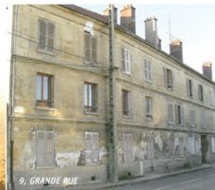
9, GRANDE RUE

Dans une édition précédente du TU, le Maire signalait que cette copropriété était à l'état d'abandon depuis des décennies et qu'il était urgent devant l'insécurité des lieux appuyé par un rapport d'expert, de déclarer et prendre un arrêté d'état de péril et d'inhabitabilité, ce qui a été fait. Cette situation a conduit le Maire, dans l'attente des travaux, à déloger et reloger quelques personnes dans les logements sociaux situés à la Conciergerie. Depuis, des travaux fastidieux ont été réalisés, par quelques copropriétaires, qui ont retiré des tonnes de déchets déposés dans les caves. À la suite de la reconstitu-