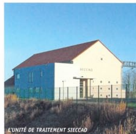
L'UNITÉ DE TRAITEMENT SIECCAO