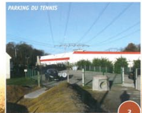
PARKING DU TENNIS

Le débat d'orientation budgétaire pour l'année 2006 portera sur la réfection de l'éclairage du terrain de football Delacoste, la réfection du chemin entre la rue des Gourdeaux et la sente qui longe le stade Delacoste, l'aménagement du parking devant le stade Delacoste, la réfection des sols des courts couverts de tennis à la suite d'une longue procédure judiciaire et d'un jugement condamnant les constructeurs, aujourd'hui disparus. Comme vous l'aurez sans doute constaté, le parking servant au stationnement des membres du club de tennis Viarmes-Asnières sur Oise est aujourd'hui terminé. Nous remercions les membres du club pour leur patience exigée par l'insuffisance de crédits. CK