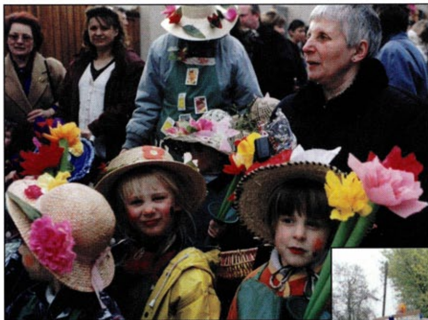
Carnaval, à Asnières sur Oise ...

Samedi 5 Avril, c'était carnaval à Asnières, avec pour thème: "Le Printemps". Les enfants et leurs enseignantes étaient vêtus de beaux déguisements qu'ils avaient confectionnés avec amour. Ils ont défilé dans les rues de notre village avant de s'arrêter sur la Place. Ils ont alors brûlé Monsieur Carnaval.