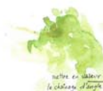
mettre en valeur le caractère d'angle

FAÇADES : enduit finition grise fine occidentaux : façade large et lisse Pignons : enduit à pierre vue