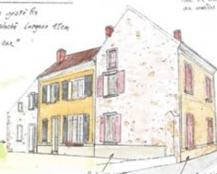
Travaux en peinture des menuiseries extérieures