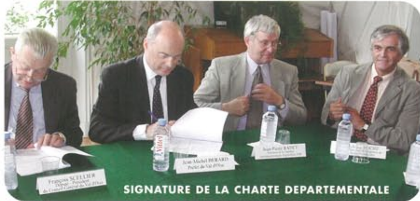
SIGNATURE DE LA CHARTE DEPARTEMENTALE

« L'eau fait partie du patrimoine commun de la nation. Sa protection, sa mise en valeur et le développement de la ressource utilisable, dans le respect des équilibres naturels, sont d'intérêt général ». Tel est l'article 1er de la loi n°92-3 du 3 janvier 1992 sur l'eau, qui fait maintenant partie intégrante du code de l'environnement. Le 4 juillet 2002, la Commune d'Asnières-sur-Oise a reçu les plus hautes personnalités du département à l'occasion de la signature de la Charte départementale pour l'instauration des périmètres de protection des captages sur les points d'eaux souterraines destinées à l'alimentation en eau potable du département du Val d'Oise.