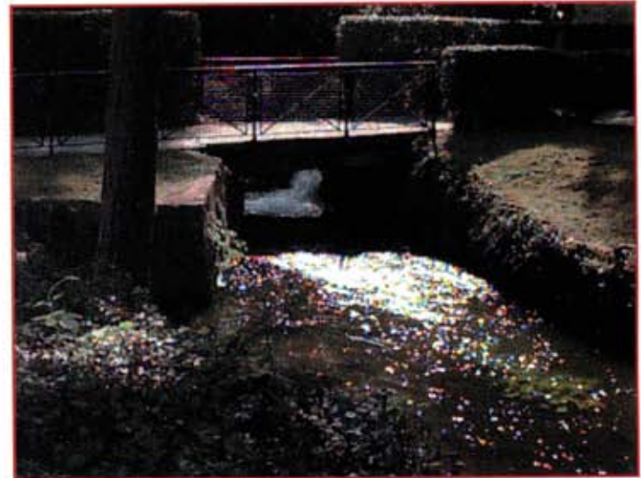
Photo du pont de Royaumont

Suite à nos démarches et réunions (cf. Trait d'Union Avril 1999) et après différentes études de faisabilité, le SIABY (Syndicat Intercommunal pour l'Aménagement du Bassin de l'Ysieux) a programmé les travaux suivants destinés à améliorer et contrôler le débit des rivières :