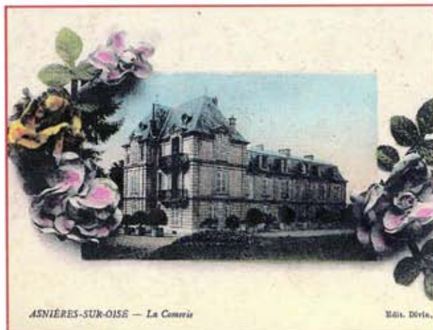
Château de la Cômerie vers 1910

Le nouveau propriétaire de la Cômerie a entrepris d'énormes travaux depuis son acquisition le 7 octobre 1997. Celle-ci a été entièrement pillée et dégradée, toute la partie centrale est écroulée. Cette superbe demeure datant, d'après les informations de Mr Jean Lévêque, de 1885 ne possédait pas à l'origine comme on peut le voir sur la photo en noir et blanc le dernier