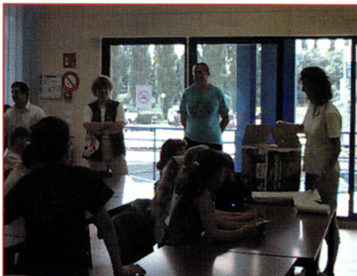
visite SICTOMIA par les enfants

Le Syndicat Intercommunal pour la Collecte et le Traitement des Ordures Ménagères de la région de l'Isle-Adam (SICTOMIA) a inauguré en juin sa nouvelle usine de traitement des déchets. Centre de tri des déchets issus de la collecte sélective, déchetterie, unité de traitement des