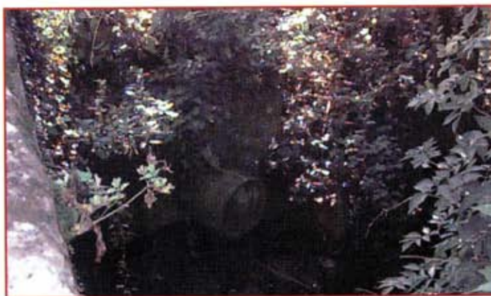
Photo du poste de refoulement à Baillon