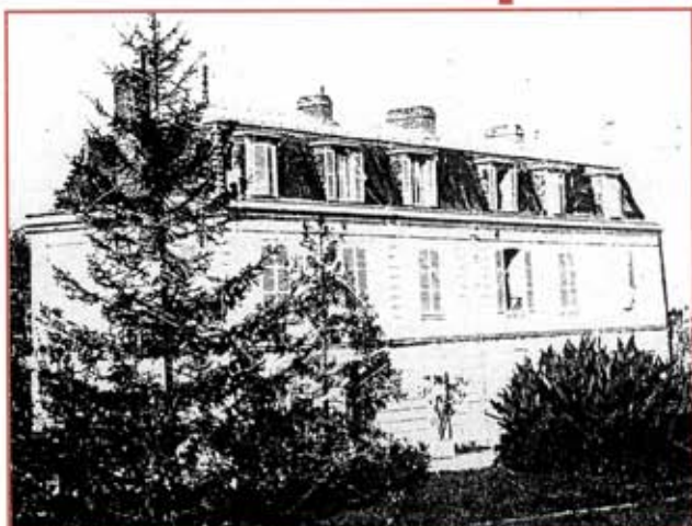
Château de la Cômerie vers 1885