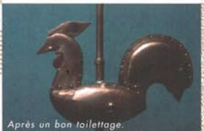
Après un bon toilettage.

Mortel arreste et lis l'histoire de mon sort, Le bien que je te veux fait que je t'y convie. Le funeste accident qui me donna la mort, Te rendra plus soigneux de conserver la vie. En l'avril de mes ans elle me fut ravie, Un peu de volupté nous fait souvent grand tort, Me laissant emporter par une jeune envie Je trouvay le naufrage où je cherchois le port. L'inconstance attachée aux choses de ce monde, Secondant en ce jour l'inconstance de l'onde, L'humide sein des flots me fit perdre le jour. Adorons le decret de la bonté supresme, J'avois sa grace en l'eau de mon baptesme En ce meme element, j'ay trouvé son sejour.