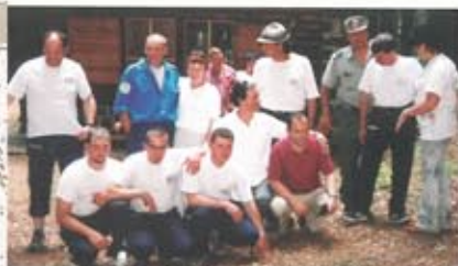
Comité de Jumelage : Trekking au Lac Scaffaiolo !