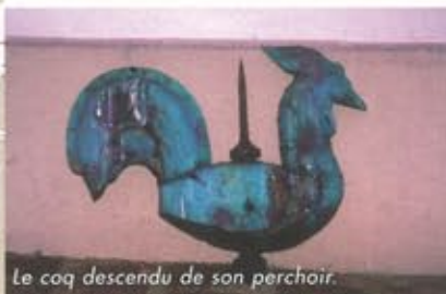
Le coq descendu de son perchoir.

« L'an 1409, la foudre tomba sur le clocher qui fut brûlé ainsi que les charpentes, à l'exception de la moitié de la nef de l'église ». Le XVe siècle ignorait l'usage du paratonnerre, inventé en 1752 par Benjamin Franklin. Celui de l'église, n'assurant pas une totale protection de l'édifice, ne répondait plus aux normes en vigueur. Il a donc été remplacé, le 28 août dernier, par un nouveau paratonnerre, à dispositif d'amorçage. La veille, le coq quittait son perchoir ; les asniérois se