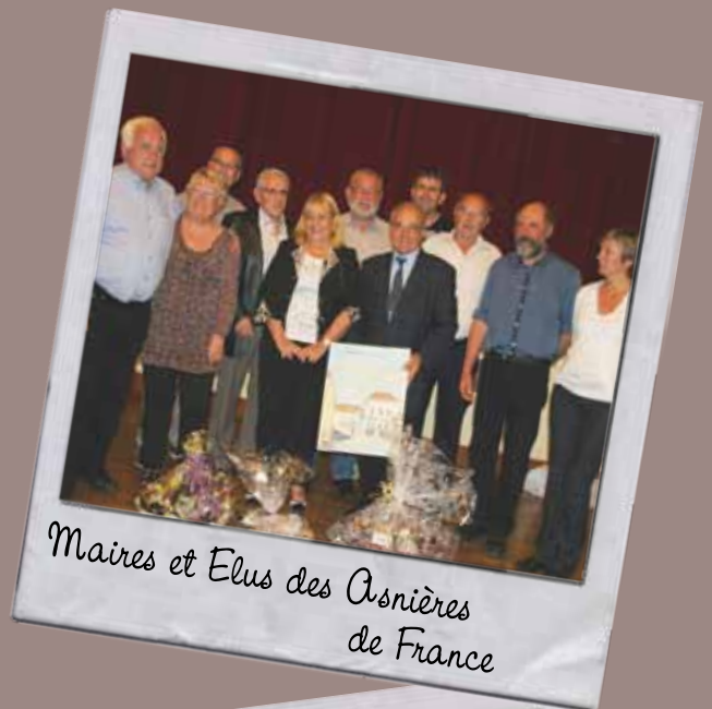
Maires et Elus des Asnières de France