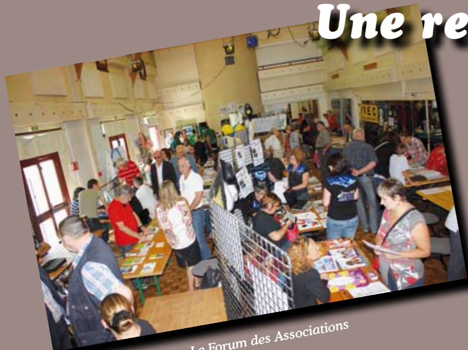
Le Forum des Associations