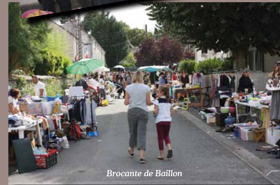
Brocante de Baillon