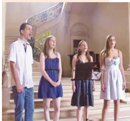
L'ensemble vocal « OPAL QUARTET »