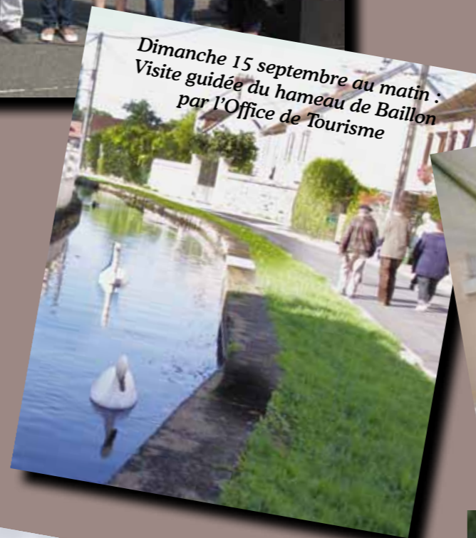
Dimanche 15 septembre au matin : Visite guidée du hameau de Baillon par l'Office de Tourisme