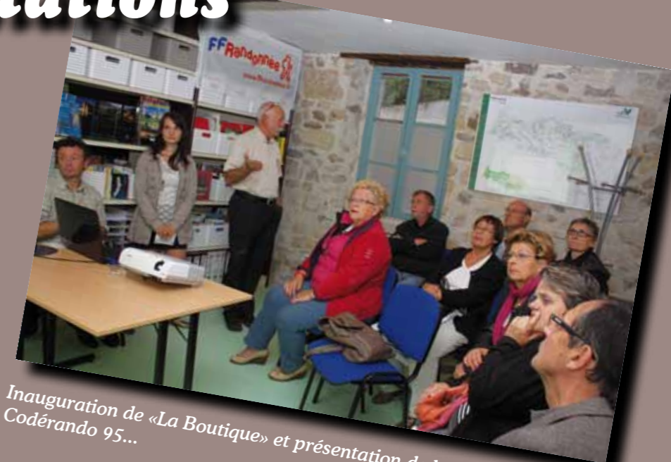
Inauguration de «La Boutique» et présentation de la Randothèque du Codérando 95...