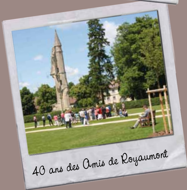
40 ans des Amis de Royaumont