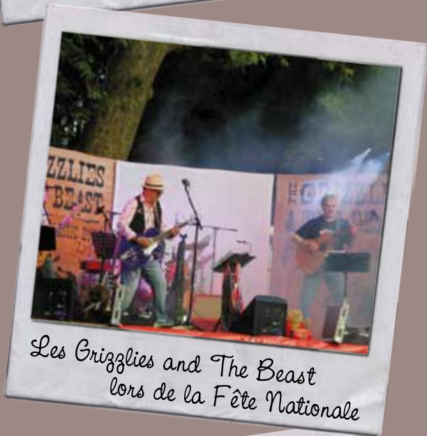
Les Grizzlies and The Beast lors de la Fête Nationale