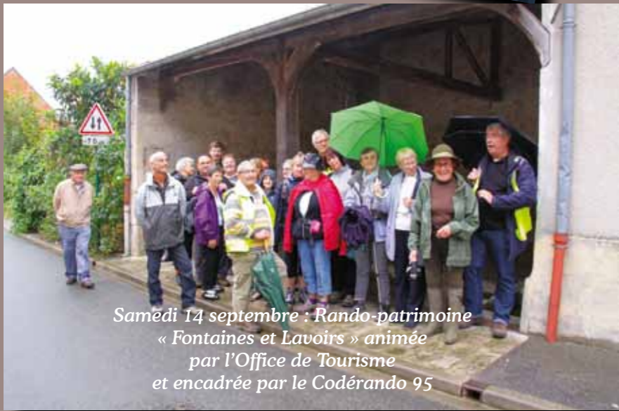
Samédi 14 septembre : Rando-patrimoine « Fontaines et Lavoirs » animée par l'Office de Tourisme et encadrée par le Codérando 95