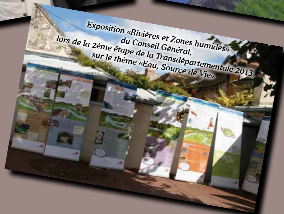
Exposition «Rivières et Zones humides» du Conseil Général, lors de la 2ème étape de la Transdépartementale 2013 sur le thème «Eau, Source de Vie»