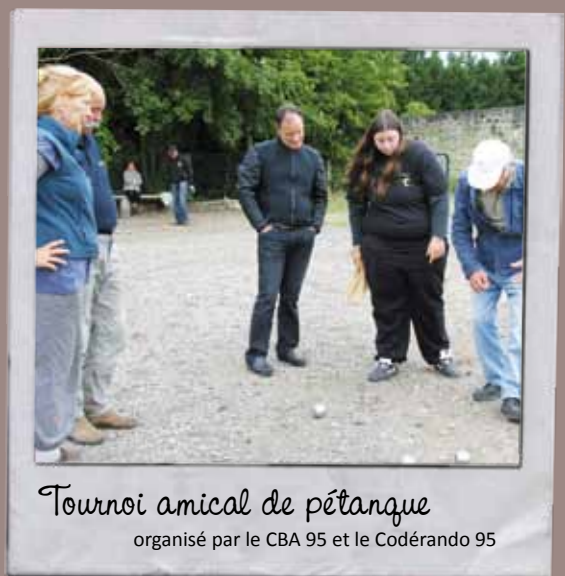
Tournoi amical de pétanque organisé par le CBA 95 et le Codérando 95

Plus d'informations et de photos sur www.ville-asnieres-sur-oise.fr