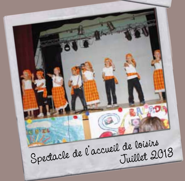
Spectacle de l'accueil de loisirs Juillet 2013