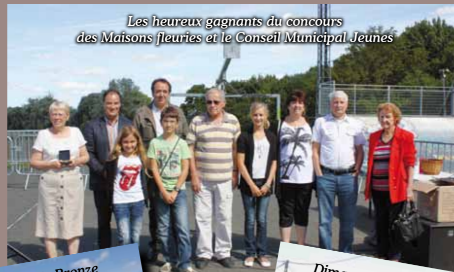
Les heureux gagnants du concours des Maisons fleuries et le Conseil Municipal Jeunes