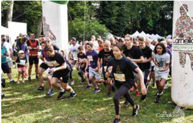
La Carnelloise est un événement sportif et convivial qui se déroule chaque année en septembre au départ du parc de Touteville.