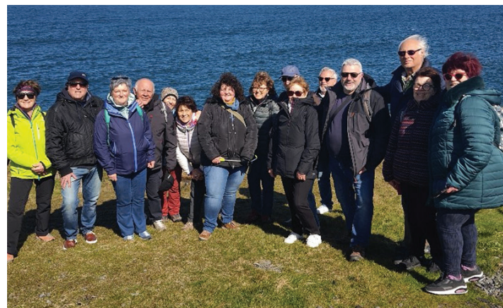
Le comité de jumelage Asnières-sur-Oise Cutigliano en Irlande du 13 au 17 avril