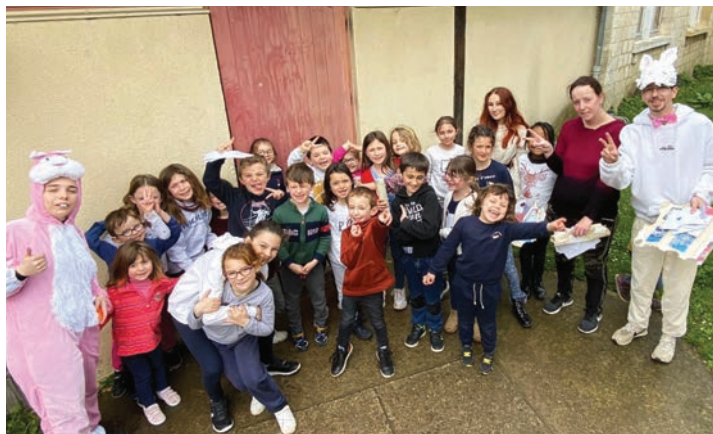
Chasse à l'œuf à l'accueil de loisirs le 12 avril