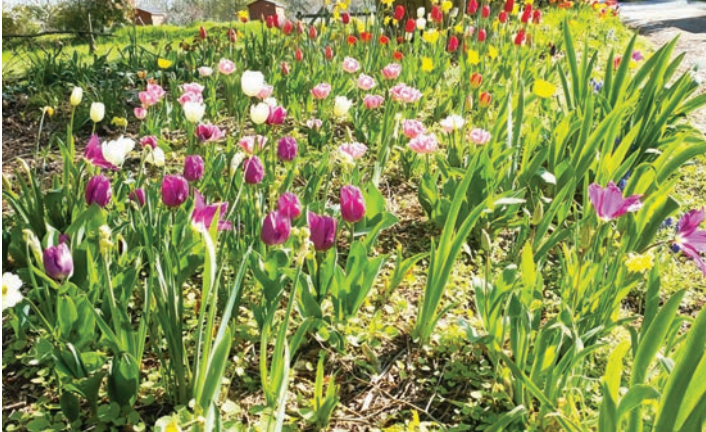
Printemps fleuri par les élèves de l'école Blanche de Castille au verger communal avec Autour du verger