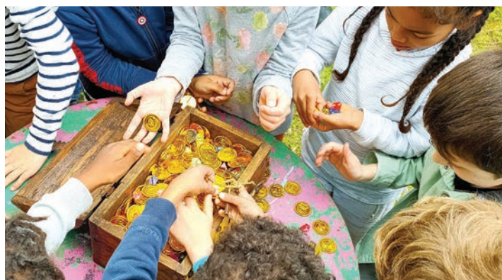
Chasse au trésor pour les élèves de l'école Blanche de Castille par Autour du verger les 17 et 18 avril