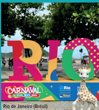
Rio de Janeiro (Brésil)